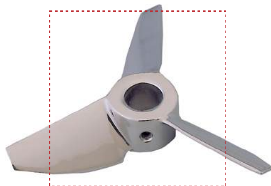
Пропеллер Lineflux (Тип 18)