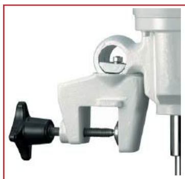
Крепление мешалки PBC